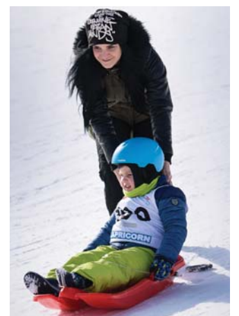
Niekedy bolo treba malým bobistom pomôcť.