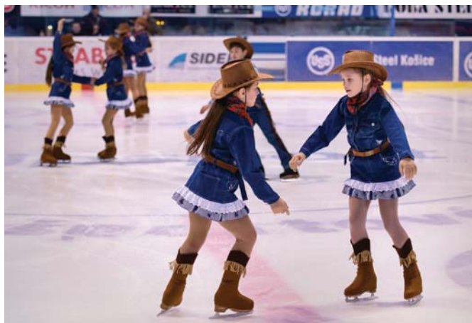
Spesťrenie programu finálového večera, vystúpenie detí z košíckeho Krasocentra.