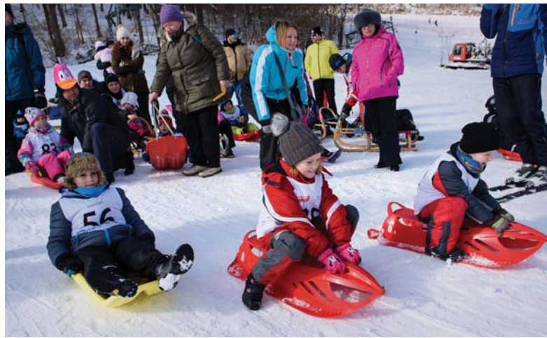
Pinou parou vpred! Deti si počas pretekov na sánkach a boboch užili množstvo zábavy.