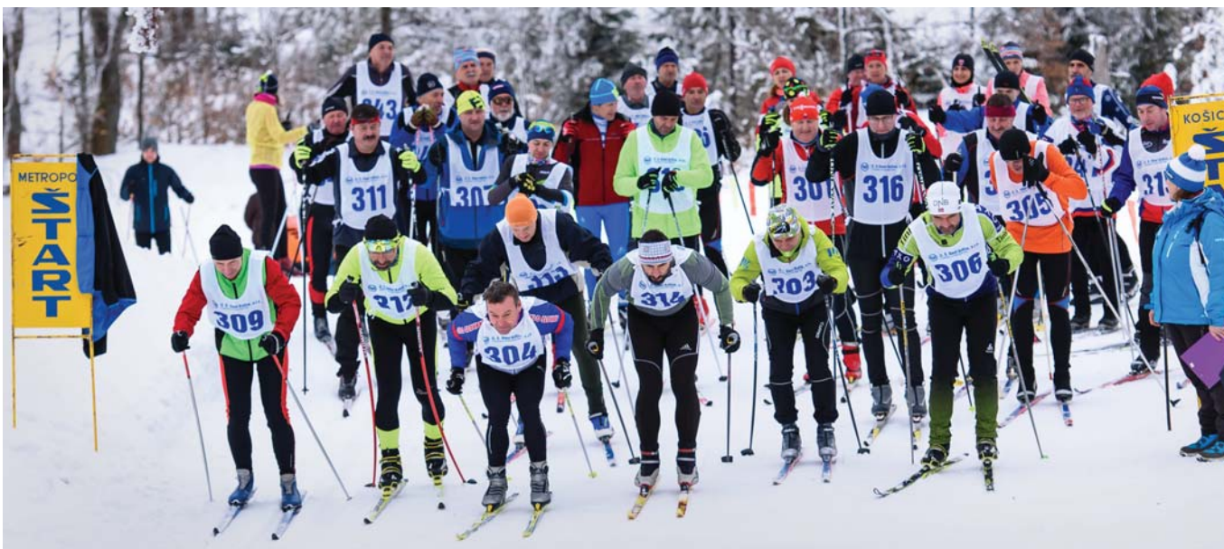
Na štarte pretekov v behu na lyžiach.

to výborný ročník. Že chýbajú mladí? Bežky sú náročný šport. Mladí si vyberajú skôr ľahšie disciplíny,“ konštatoval.