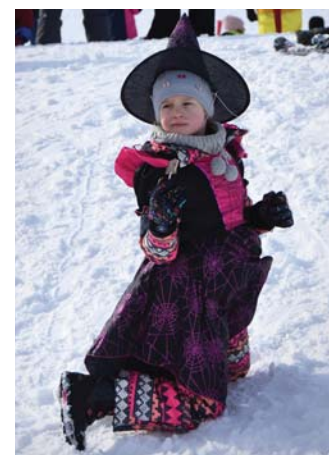
Malá zamyslená čarodějnice.