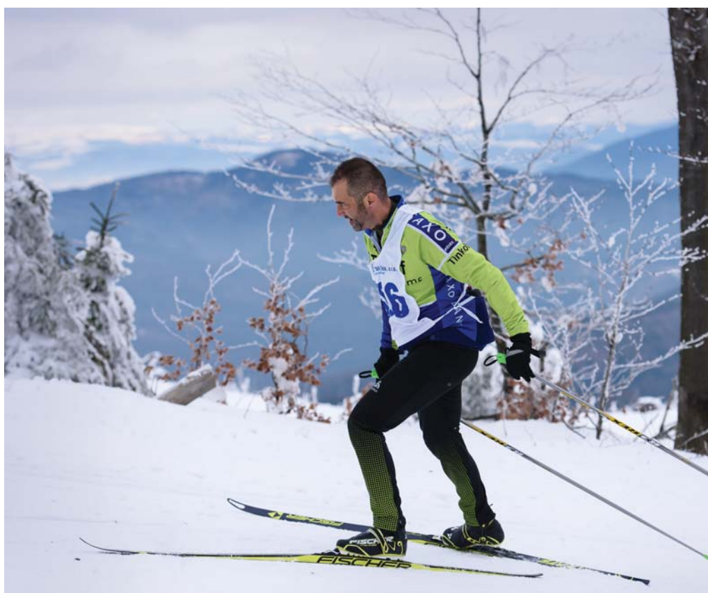
Keby to neboli preteky, bola by to prechádzka rozprávkovo zasneženou krajinou. Tohto roku sa počasie na Kojšovke skutočne vydarilo.