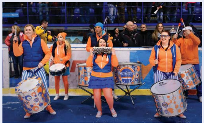
Divákovi pomáhali dostať do varu aj bubeníci z nitrianskej skupiny Tambores.