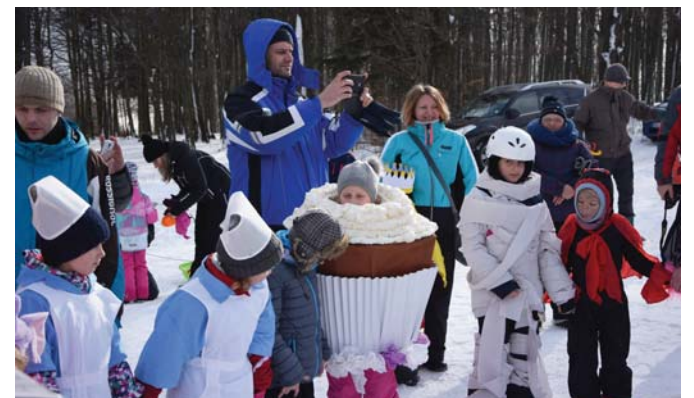
Malý čertík aj Veľký muffin. Deti a ich rodičia ukázali, že majú fantáziu.

Prípravil: Laco KEREKEŠ.