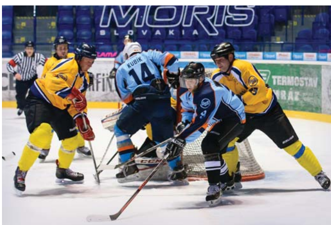
Márna snaha hráčov Finishingu. Brankára Dopravy sa im vo finále prekonať nepodarilo.