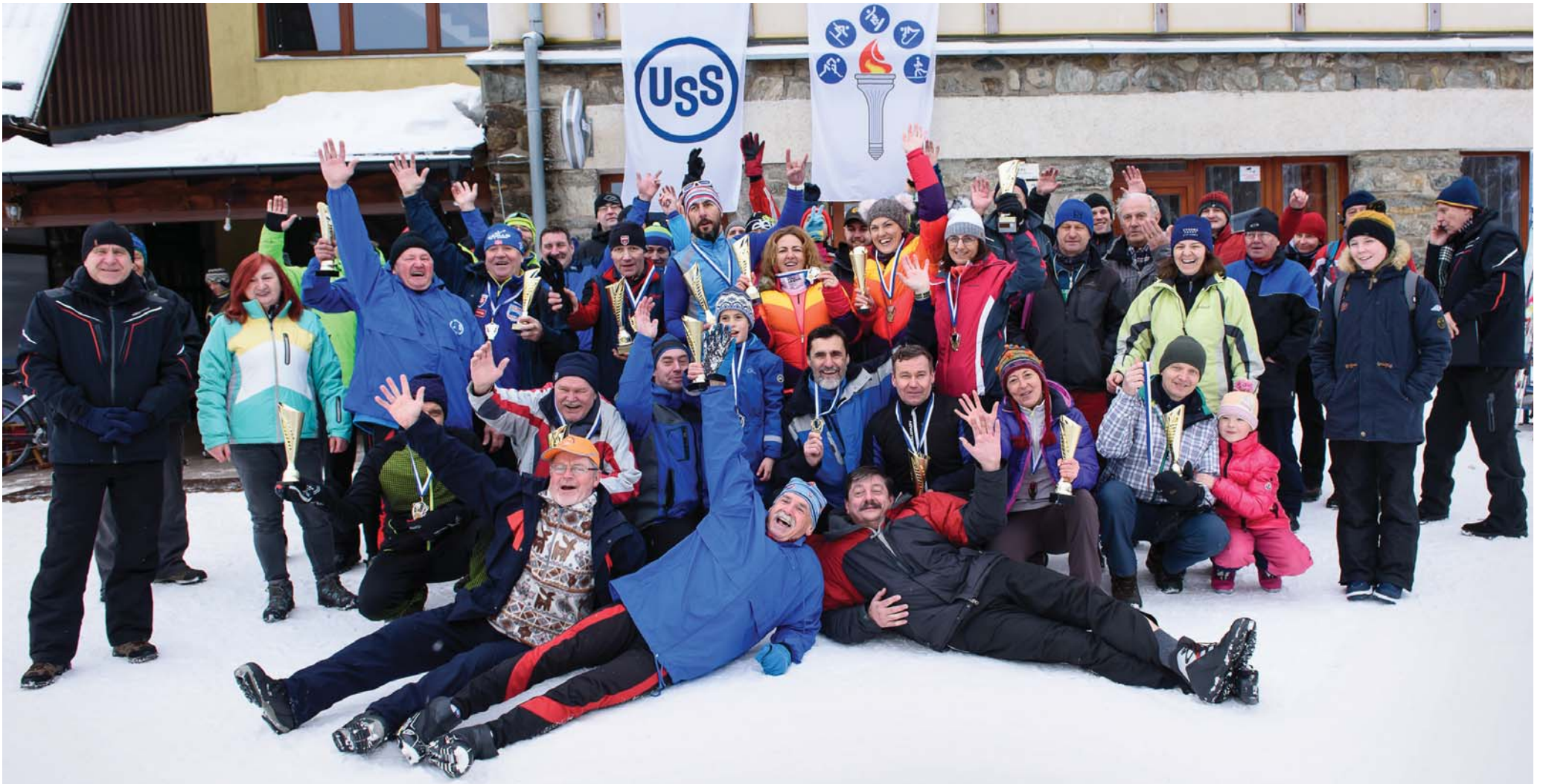
Dovidenia na Kojšovskej holi opäť o rok. Spoločná fotografia účastníkov pretekov v behu na lyžiach bude peknou spomienkou na jeden z najvydarenejších ročníkov súťaže, do ktorého sa prihlásilo päťdesiat športovcov z radov zamestnancov firmy.

Organizátori by v budúcnosti na štarte radi videli viac mladých