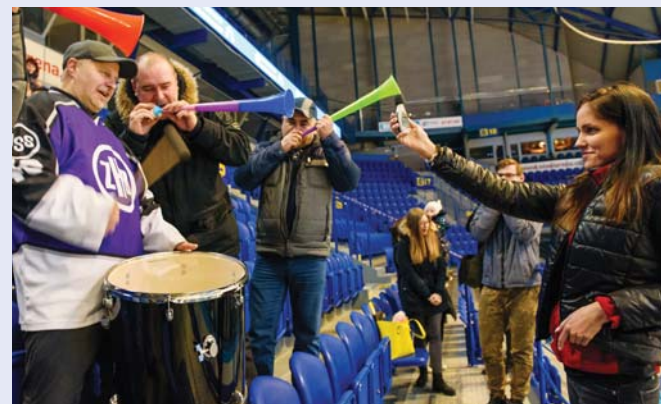
Najhlučnejší fanklub mali Radiátory a rúry.

taktiež vyžreboval desať výhercov spomedzi 87 platných lístkov v rámci tipovacej súťaže so správnymi tipmi na finalistov.