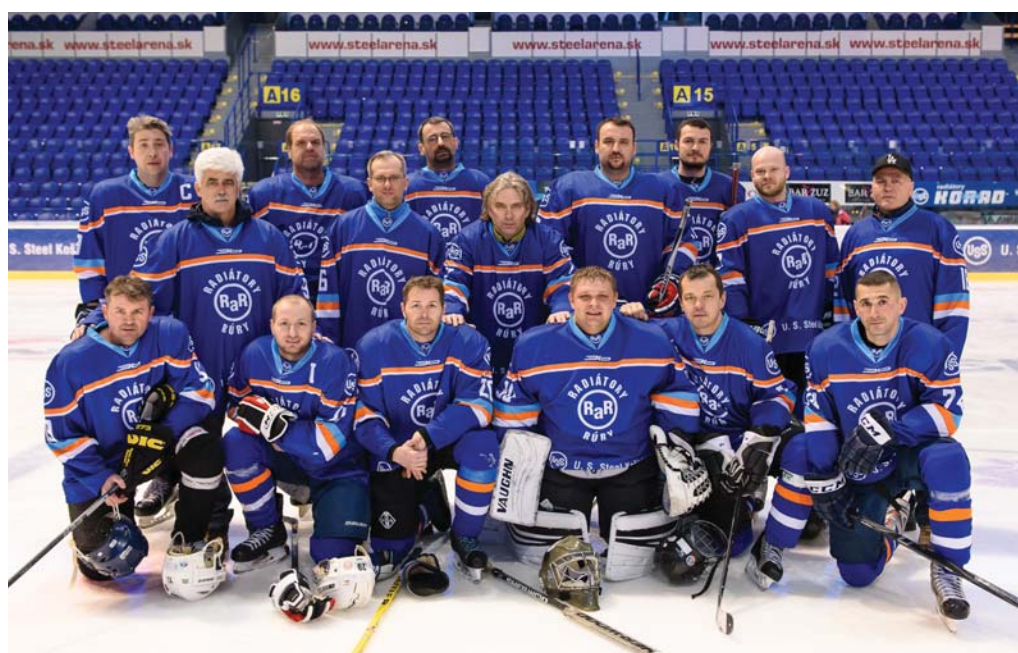
RADIÁTORY A RÚRY