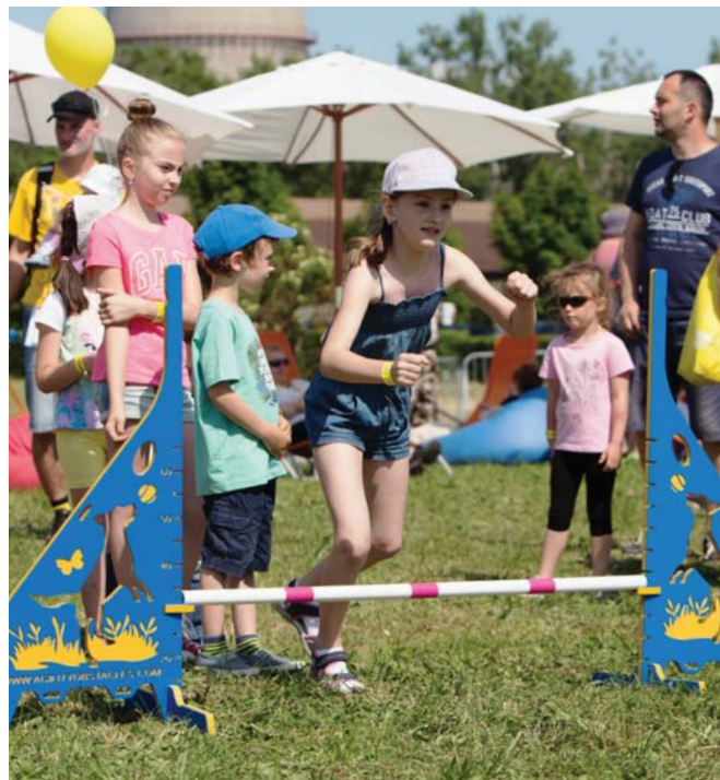
Po psíkoch si vyskúšali prekážkovú dráhu aj deti.