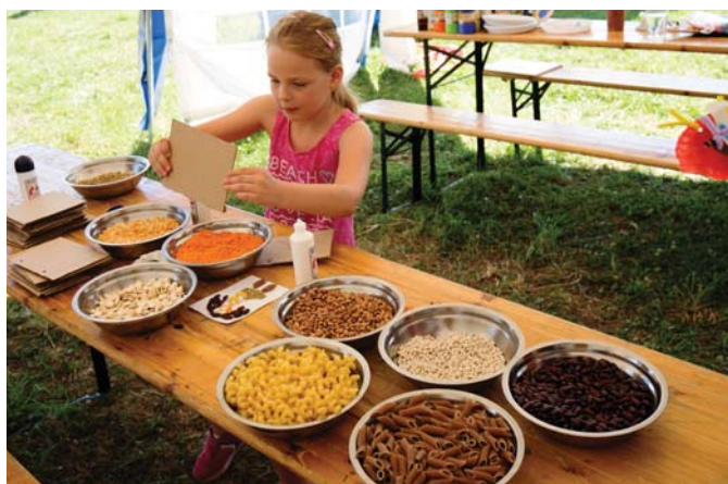
Zo strukovín, semien a cestovín sa dali poskladať pekné obrázky.