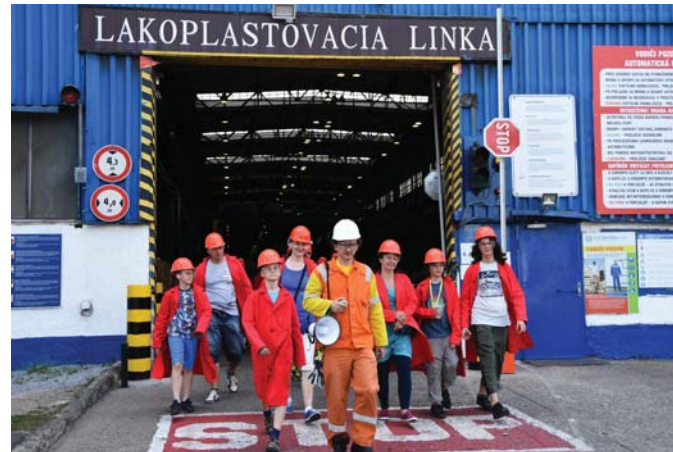
Po prvý raz mali návštevníci počas dňa otvorených dverí možnosť zavítať do prevádzok studenej valcovne, vidieť dynamolinku i lakoplastovaciu linku.

NAJBLIŽŠIA OCEĽ VÝCHODU VYJDE V STREDU 12. JÚLA 2017