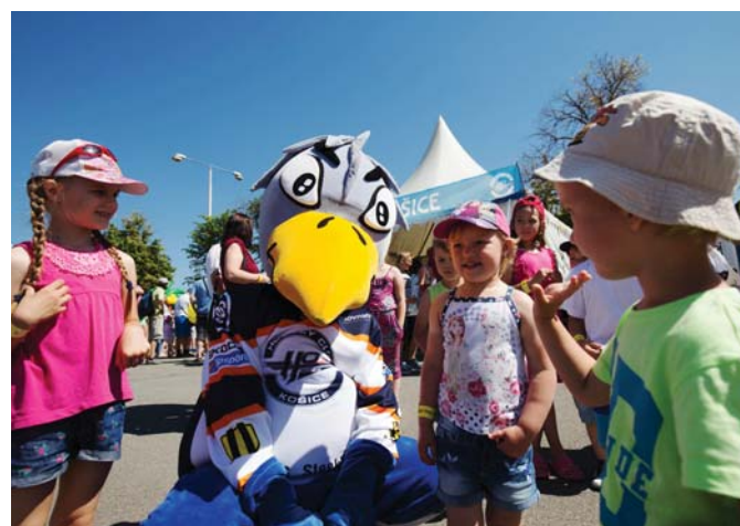
Kde je maskot Vrana, tam sú úsmevy detí zaručené.

nimi zlanárimo nové talenty, pretože košický hokej potrebuje veľa talentov. Moje pocity sú však výborné a veľmi ma teší, že náš stánok patril medzi najobľúbenejšie. Dúfam, že v takomto počte sa stretneme čoskoro aj v Steel aréne,“ pozval hokejových fanúšikov do košického hokejového svätostánku pre-