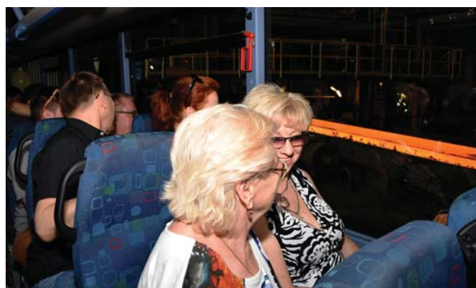
Prítomných v autobuse zaujali aj žeravé bramy, ktoré z narážacích pecí putovali na ďalšie valcovanie po trati TŠP.