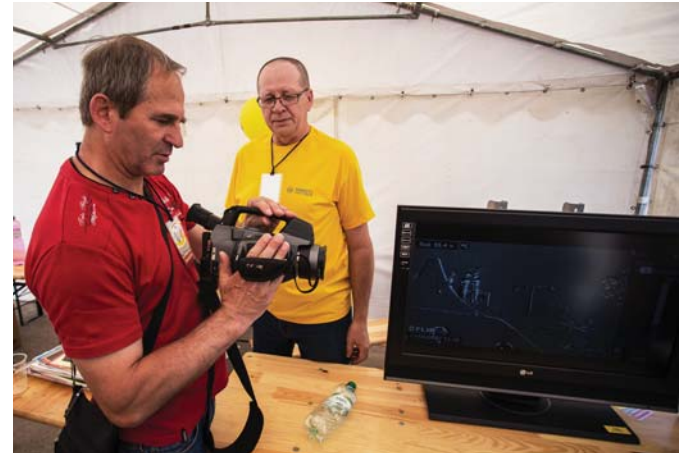
Stredobodom záujmu bola aj FLIR kamera, ktorá slúži vo firme na detekovanie únikov plynov.