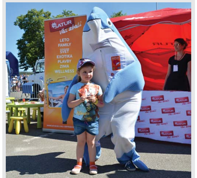
Po prvý raz sa na Family Safety Day predstavila aj cestovná kancelária Satur, ktorá venovala do zberovania jednému zo šťastlivcov 200-eurový poukaz na nákup zájazdu z jej aktuálnej ponuky.