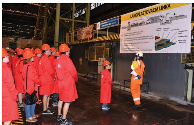
Záujemcovia o pešiu prehliadku sa v hale lakoplastovacej linky oboznámili aj s postupom výroby, čo všetko sa na plech nanáša a aké ochranné vrstvy obsahuje.

Z toho, čo videla, bola nadšená: „Bolo to veľmi pekné, videli sme tu veľa zaujímavého, ani som si nemyslela, že fabrika je až taká veľká. Ako jedno menšie mesto. V budúcnosti by som si rada pozrela niektorú z prevádzok priamo a zblízka.“ Zvedavosťou