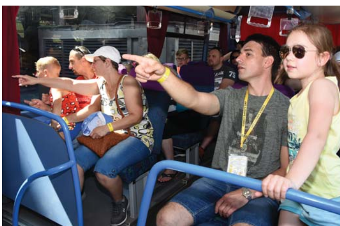
„Aha, tam to je, kde tečie žeravé železo do nádoby,“ ukazujú rodičia deťom pri vysokej peci.

Podobne ako po iné roky, aj počas tohtoročného podujatia Family Safety Day pripravili organizátori pre návštevníkov prehliadku našej fabriky. Niektorí si mohli so svojimi mladšími ratolesťami do 12 rokov pozrieť jednotlivé závody a prevádzky počas jazdy z autobusu, iní zase využili jedinečnú príležitosť vidieť po prvý raz počas pešej prehliadky studenú valcovňu, dynamolinku, lakoplastovacu linku i časť expedície. Už na parkovisku boli najmä návštevníci, ktorí sa do fabriky chystali po prvý raz, zvedaví, čo môžu od spomínaných prehliadok očakávať. Iní zase chceli vedieť, čo sa za ten rok vo firme zmenilo.