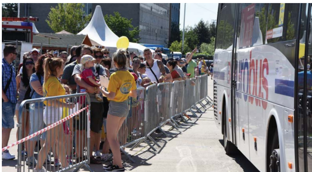
Kým jeden z autobusov práve odchádza do firmy, ďalší záujemcovia sa už zoradujú na prehliadku.