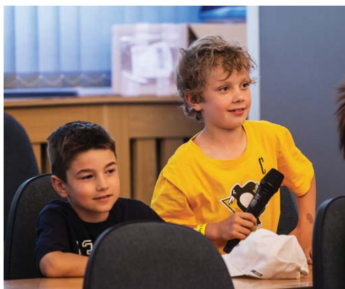
Deti sa veru neokúňali, v šikmej zasadačke padali jedna otázka za druhou.