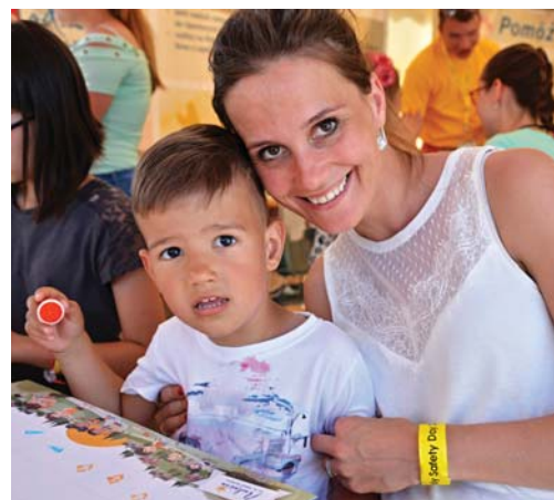
Vyrobili naozajstné pexeso deťom netrvalo dlho.

te. Možno cez prázdniny pobaví kopec chlapcov a dievčat.