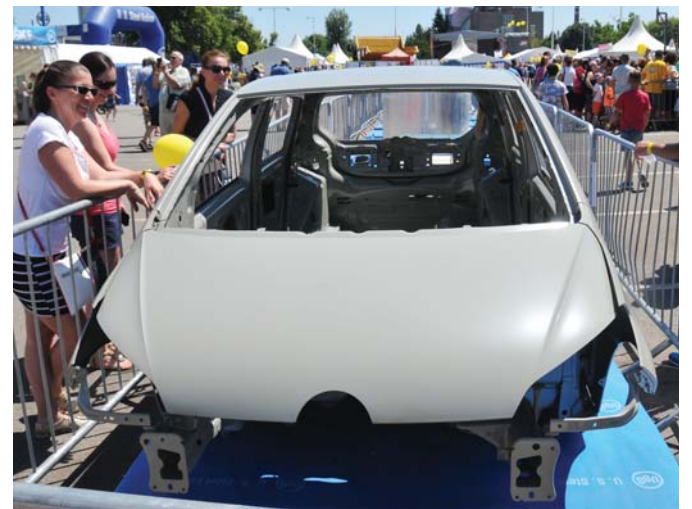
Zrak okoloidúcich púta i karoséria Volkswagenu.

aj rôzne elektrospotrebiče bielej techniky či radiátory, ktorých novinka – fotoprotlačená čelná strana vyhrievacieho telesa podľa návrhu či výberu objednávateľa už oslovila nejedného zákazníka. A pri prechádzke areálom parkoviska sa nedal nevšimnúť rad vystavených zvitkov plechov najroznejších akostí a povrchov, na konci ktorého trónila karoséria Volkswagenu up. -c-