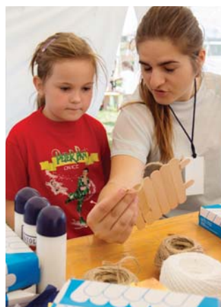
V kreatívnych dielniach sa fantázii medze nekladli. Špachtle poslúžili na výrobu spomienkových predmetov.