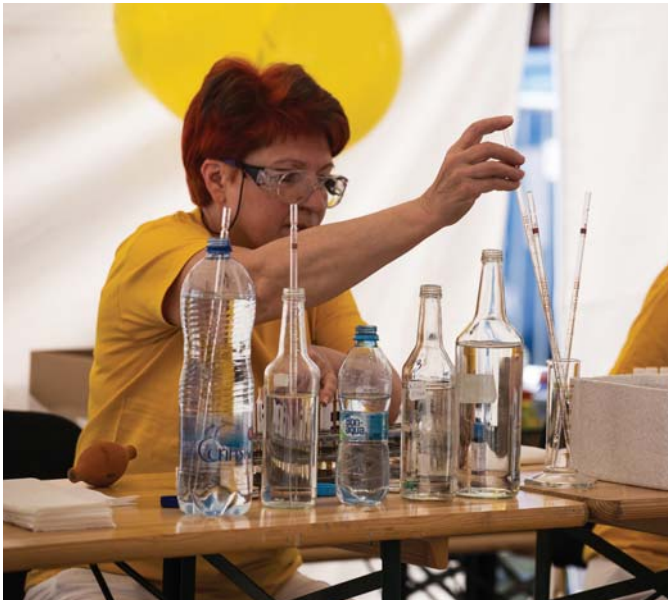
Laborantky v stane ekológie urobili počas podujatia sedemdesiatštyri rozborov vzoriek pitnej vody.