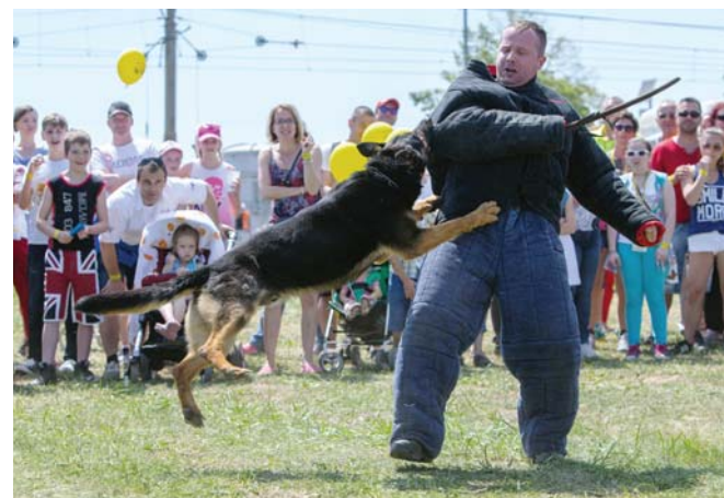
Neposlúchnuť pokyny policajta sa nevypláca. Drzý zlodziej to zistil veľmi rýchlo.

Vytvoríte koridor, o chvíľu to tu bude nebezpečné! Žiadali usporiadatelia na zaplnenej lúke deti s rodičmi o vyprázdnenie časti priestoru. Nebezpečné to však bolo len pre jediného policajta, ktorý sa zahral na lupiča na úteku. A to veru robí nemal. V tej chvíli sa totiž na neho vyrútila deväťročná fenka Wassabe,