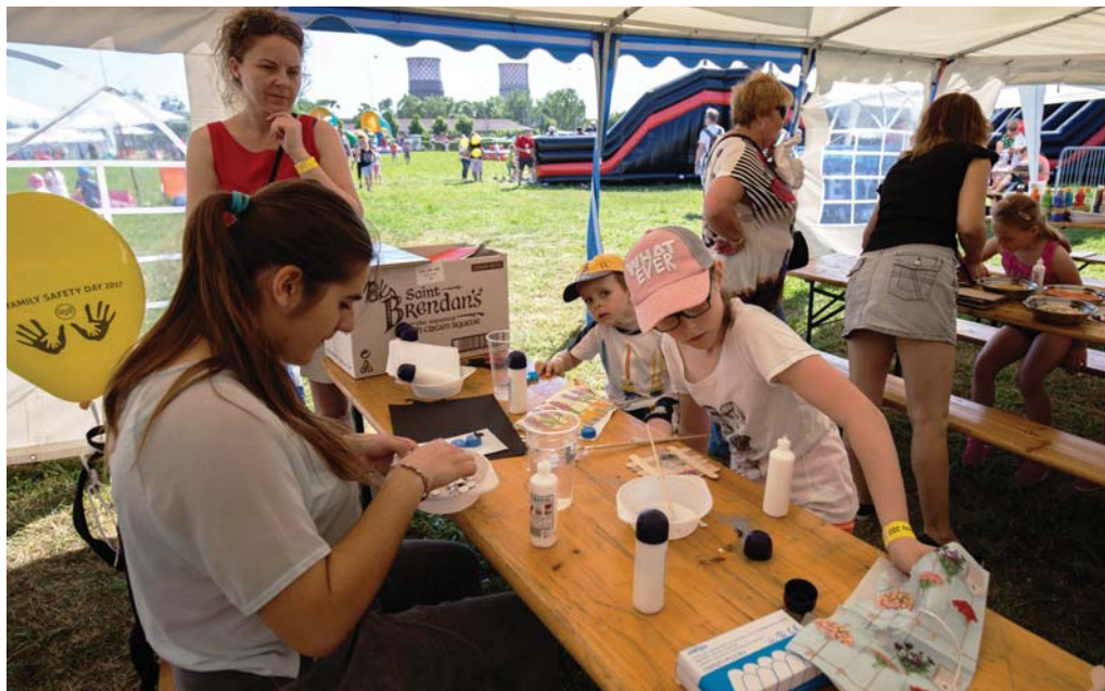
Servítkovú techniku zvládli aj malé deti.