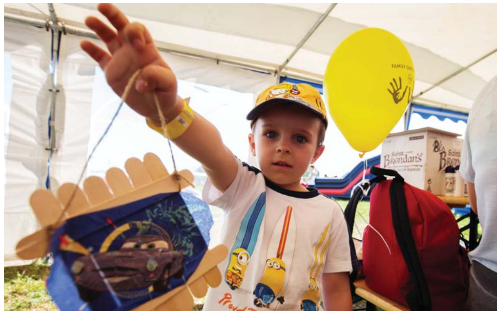
„Aha, čo mám! A to som urobil sám.“ V tvorivých dielniach sa tvorili kadejaké výtvary.