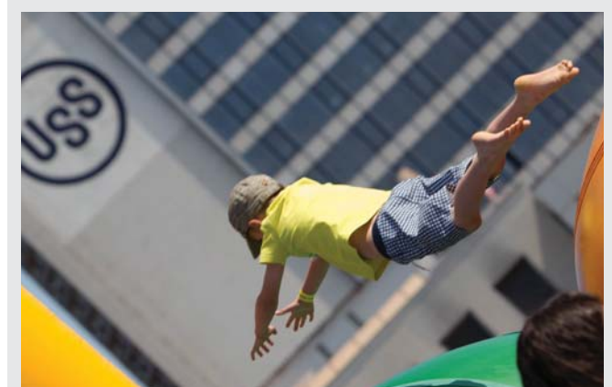
Hoplá! Poriadne vyskočí!