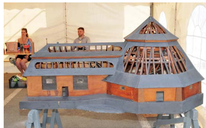
Múzejníci sa prišli pochváliť aj funkčným modelom gápla – zariadenia na ťažbu soli.

nejší, museli ubehnúť storočia. Dovtedy bola prístupná len na cisárskych a kráľovských dvoroch, napríklad v Prahe či vo Viedni. To je len zlomok zaujímavých informácií, ktoré sa mohli železiari a ich rodiny dozvedieť, ak prijali pozvanie do stánku Slovenského tech-