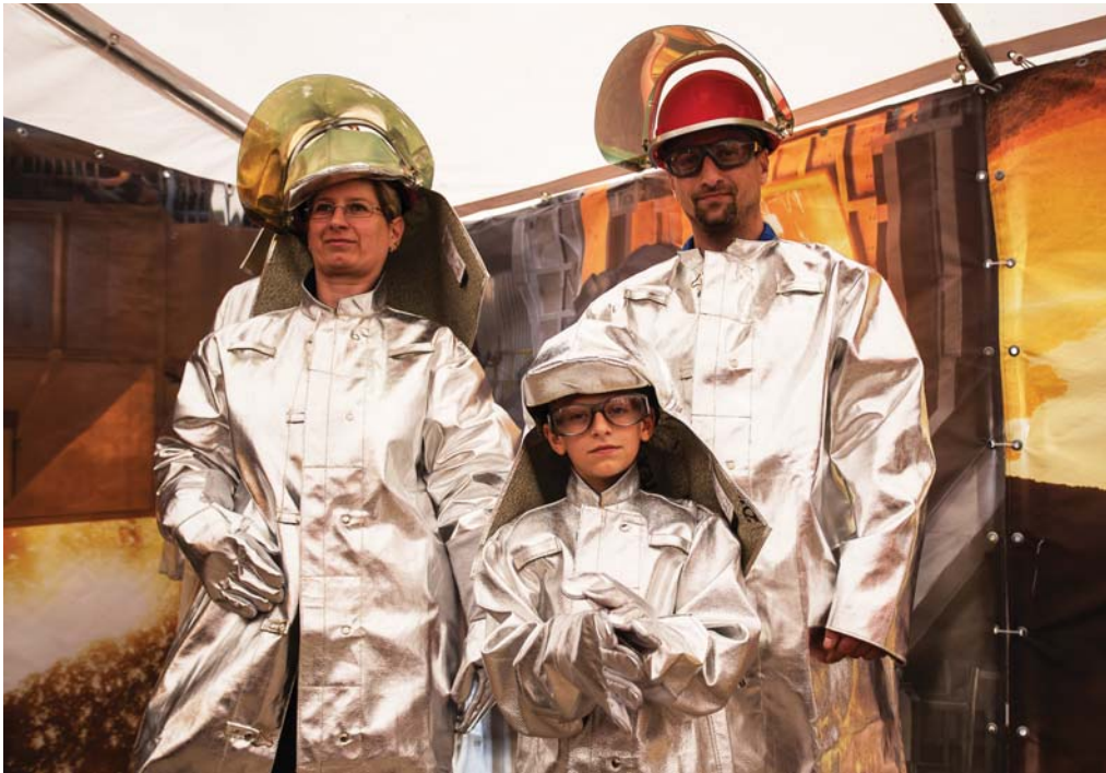
V stane Safety...

„Bezpečiaci“ pripravili vo svojom stane pre zvedavých návštevníkov celý rad zaujímavých aktivít. Ponúkli, okrem iného, množstvo detailných informácií o osobných ochranných pracovných