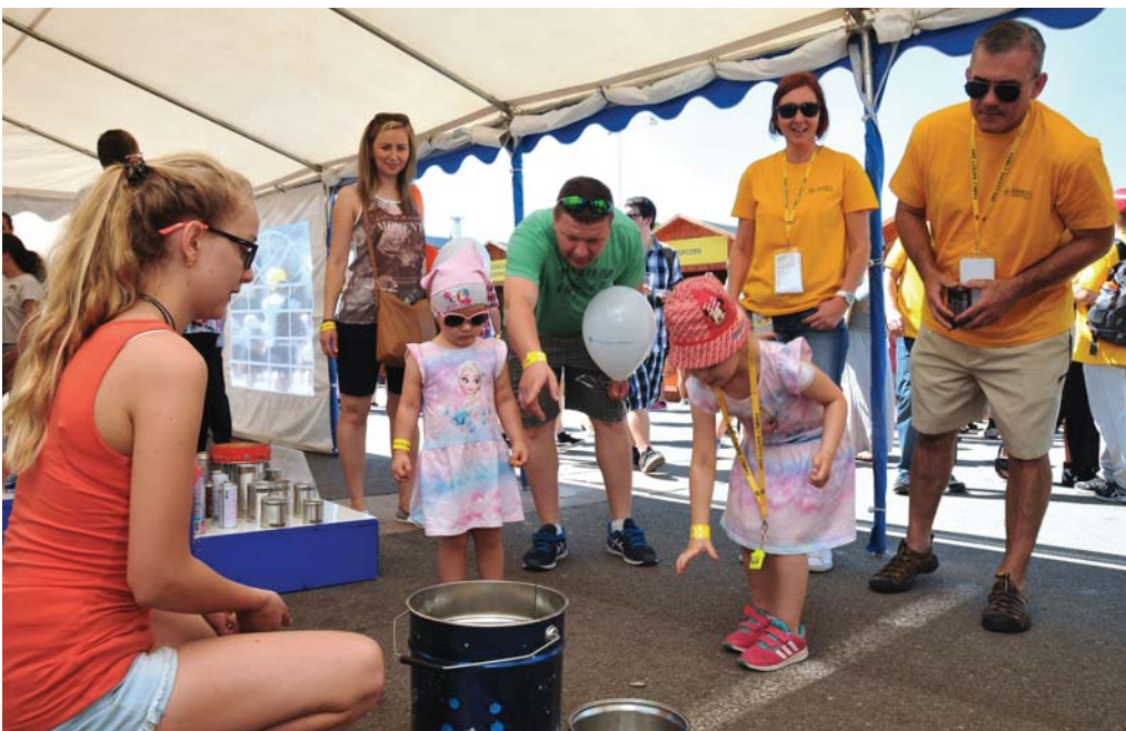
V stane Výrobky dospeláci nasávali informácie, deti si mohli zasúťažiť. Aj v hode vrchnáčikov do plechovky.

Nadáci U. S. Steel Košice, ktorú košická oceliaren založila v roku 2002 a ktorá odvtedy podporila stovky projektov v oblasti zdravotníctva, vzdelávania, charity, environmentu či športu na východnom Slovensku, vyšla premiérová prezentácia na Family Safety Day excelentne. Stánok, ktorý si rozložila hneď vedľa kolotočových atrakcií na parkovisku, bol plný detí i dospelých, a to skutočne od začiatku až do konca podujatia. Aj vďaka príťažlivým tvorivým dielňam, ktoré prilákali malé deti, tínedžerov, ale aj dospelých. Na voľné miesto pri stoloch, kde sa kreatívne nekládli žiadne medze, si bolo treba aj počkať. A mnohí to aj veľmi radi urobili.