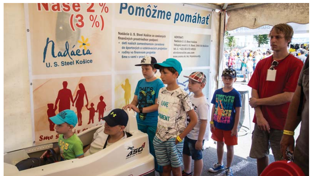
Čosi pre chlapcov. V stane Nadácie U. S. Steel Košice si mohli deti vyskúšať aj simulátor formuly.