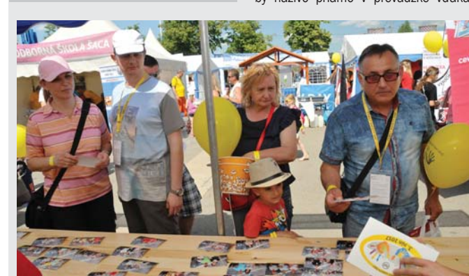
Po hotové fotografie si mohli návštevníci prísť o dvadsať minút...

Fotokútik, v ktorom sa dalo zvečniť stále by naživo priamo v prevádzke vďaka