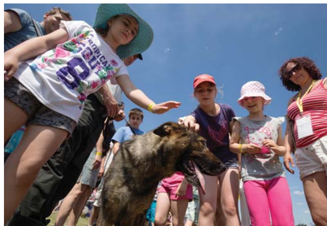
„Ujo, môžem ju pohladkať?“ Policajná fenka sa stala po zásahu miláčikom detí.