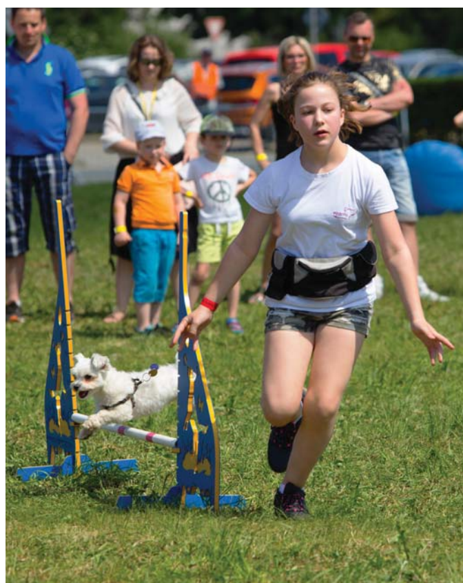
Výcviky agility zvládali psyky malé i veľké.

Ktoré dieťa nemá rado štvornohých chlupáčov? Akonáhle posiali stred lúky plnej nafukovacích atrakcií pestrofarebné prekážky určené pre ukážku výcviku psíkov, vytvoril sa okolo nich kruh zvedavých očíek. „Pozri ocko, akí sú roztomilí a zlatí. Toho najrýchlejšieho by som si hneď vzala domov,“ usmievala