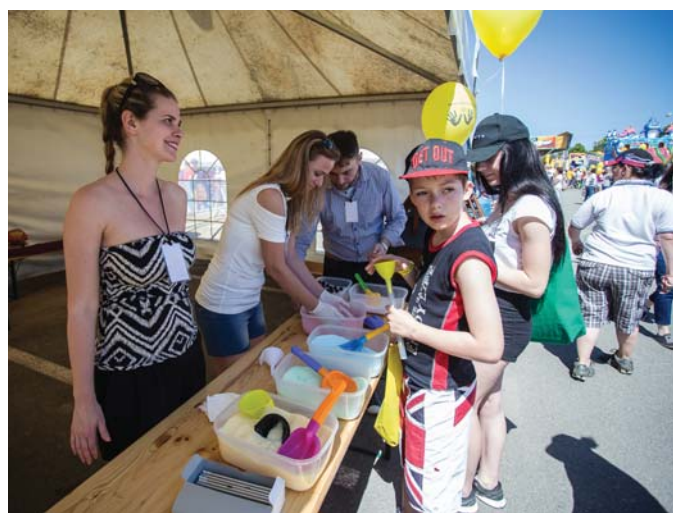
Aj vy ste si odniesli téglik s farebnou soľou do kúpeľa z dielne Slovenského technického múzea v Košiciach?