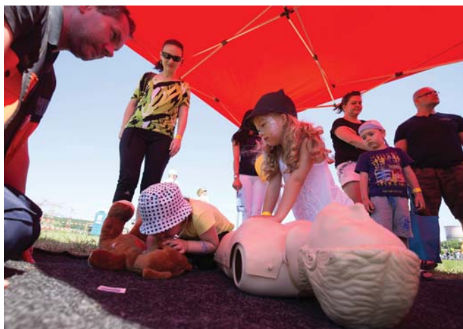
Najmenšie detičky si vyskúšali dýchanie z úst do úst s plyšovým mackom.