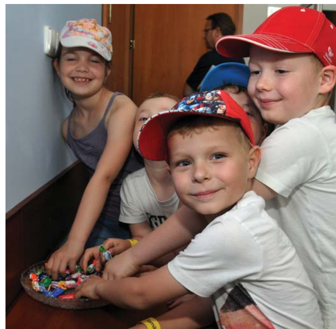
Cukríky máme radi. Sladkosťami deti neodolali...