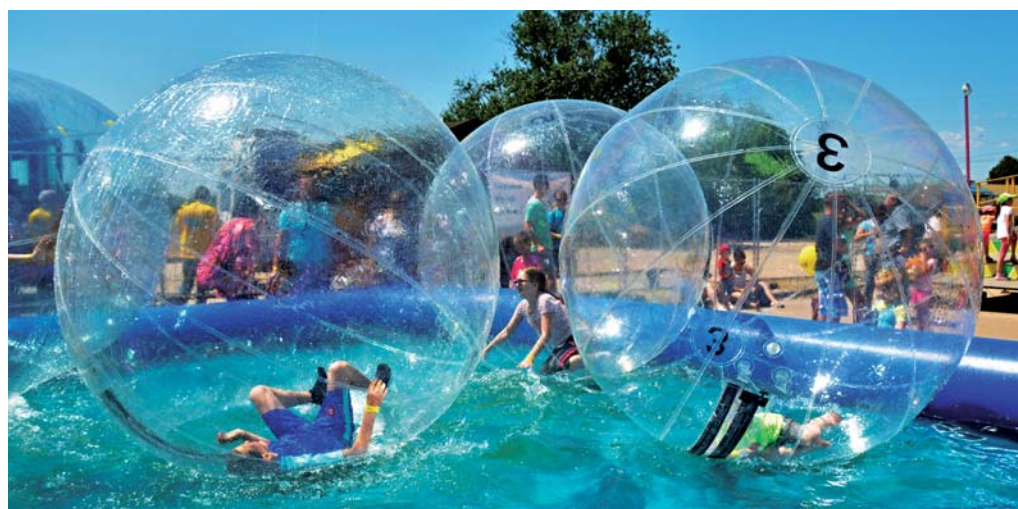
Aquazorbíng bol veľkým lákadlom a deti si v guľkách na vodnej hladine užíli množstvo zábavy.

Podujatie Family Safety Day zmapovali: Magdaléna FECURKOVÁ , Milan KATUNSKÝ , Ladislav KEREKEŠ a Peter JESENSKÝ