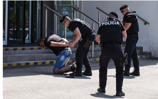
Príslušníci Pohotovostného policajného útvaru v akcii...

už riadnym školákom, nemohol od napínaveho „divadla“ odtrhnúť zrak. „Policajné autá, sanitky, hasiči - to je jeho svet. Iné autíčka ani doma nemá,“ poznamenala dcéra nášho kolegu z energetiky, ktorý na akciu kvôli pracovnej zmene prísť nemohol, no rodina si ju nenechala ujsť. „Sme na tejto akcii po prvý raz, ani sme toľko zaujímavých vecí, ktoré sa tu dejú, nečakali. No a táto ukážka je pre nášho To-