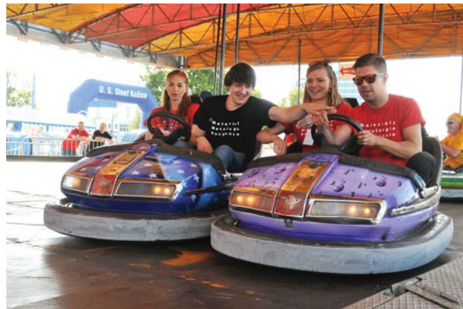
Počas zafazkávacej skúšky autodrômu.

V stane Hutníckej fakulty Technickej univerzity v Košiciach bolo rušno už od skorého rána. Študenti a pedagógovia z fakulty, ktorá už čoskoro zmení svoj názov na Fakultu materiálov, metalurgie a recyklácií (na čo upozorňovali aj ich nové tričká), sa zapojili nielen do prípravy programu, ale pomáhali aj pri registrácii účastníkov a vzali na seba dokonca aj úlohu testovacích pilotov. Boli to práve oni, kto absolvoval rannú zafazkávaciu skúšku autodrômu a húsenkovej dráhy ešte predtým, ako do areálu vošli prví návštevníci.