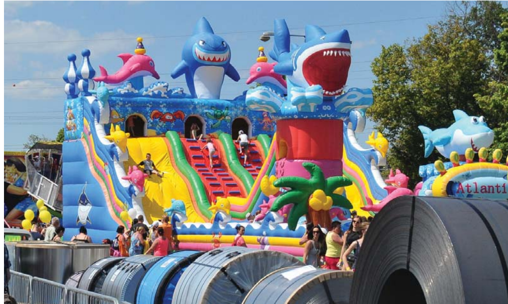
Nafukovací hrad deti obkľúčili už od rána.