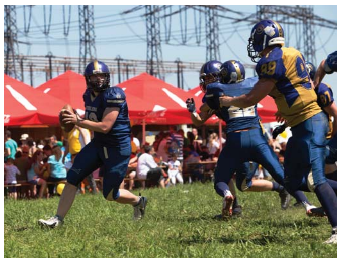
Ukážka amerického futbalu v podaní Cassovia Steelers zaujala. Tvrdí chlapi v prilbách sa nešetrili a exhibičný minizápas odohrali na sto percent.