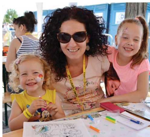
Do maľovania plátnených tašiek sa pustili najmä dievčatá.