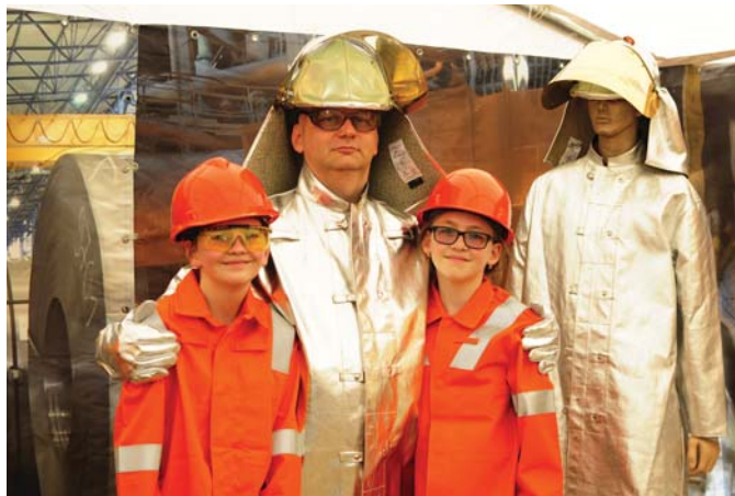
Hutnícka robota je riziková. Myslíme na to, keď sa nám začína zmena. Pre naše rodiny je najdôležitejšie, aby sme sa domov z práce vrátili v rovnakom zdraví, v akom sme do nej odišli...

V dnešnom vydaní Ocele východu sa k tejto skvelej akcii vraciame. Oživiť si ho môžu naši čitatelia v bohatom informačnom bloku na stranách deväť až šesťnásť, ktorý dopĺňa fotogaléria aj na intranete a webovej stránke spoločnosti. A určite poteší aj ďalšia správa - už čochvíľa si budete môcť pozrieť i filmové spracovanie podujatia Family Safety Day 2017. Stačí kliknúť na www.usske.sk