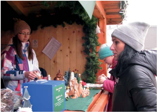
Charitatívny vianočný stánok na Hlavnej ulici v Košiciach poskytol zázemie desiatkam neziskových a charitatívnych organizácií, ktoré v ňom ponúkali najmä rôzne kreatívne vianočné dekorácie a ozdoby a získali tak peniaze na svoju ďalšiu činnosť.

Občianske združenie ArtEst - polyestetické vzdelávanie znevýhodnenej mládeže od svojho vzniku úzko spolupracuje s Nadáciou U. S. Steel Košice. Prostredníctvom charitatívnych stánkov v predvianočnom období máme každoročne možnosť prezentovať svoje aktivity a tým šíriť povedomie o umeleckom nadaní a šikovnosti hendikepovanej mládeže.