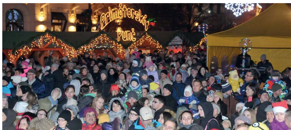
U. S. Steel Košice podporuje od svojho príchodu do Košíc významné mestské podujatia. Patria k nim najmä aktivity organizované pri príležitosti Dňa mesta Košice, ale aj Košických Vianoc.

mimoriadne pozitívne prekvapil. Dozvedel som sa, že U. S. Steel Košice má záujem podporiť Salamandrové dni a celoslovenské oslavy Dňa baníkov, hutníkov, naftárov a geológov v Banskej Štiavnici. Teším sa z toho, že podpora U. S. Steel neustala ani v horších časoch a je našim kontinuálnym a spoľahlivým partnerom a zamestnanci a vedenie podniku navštevujú Banskú Štiavnicu každoročne. Verím, že aj prírástlo naše mesto k srdcu a chvíle v ňom si užívajú. Okrem skvelej spolupráce určite nielen mne, ale aj mnohým štiavničanom, utkvelo prvé zapojenie skupiny bubeníkov Tambores pod hlavičkou U. S. Steel do nášho sprievodu a energia, ktorú mu dodali. Stále máme na túto, už opakujúcu sa účasť, veľmi dobré reakcie.