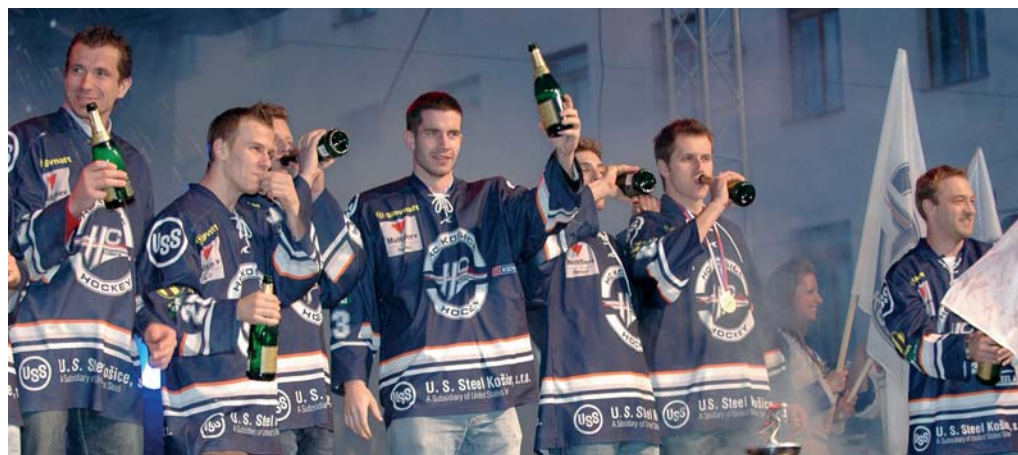
Oslavy Sme majstri! z roku 2009 na Hlavnej ulici v Košiciach.

U. S. Steel Košice už dlhé roky podporuje náš krasokorčuľarský klub Kraso Centrum Košice. Túto podporu si nesmierne vážime. Pre náš klub je každá finančná pomoc veľmi vítaná. Príspevkov U. S. Steel veľmi pomáha pri za-