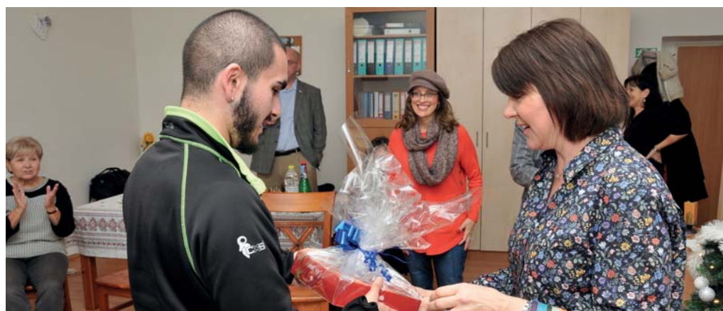
Do projektu Stromček priani sú zapájaní aj mladí ľudia z Domova na pol ceste Košice Alžbetina. Mladí ľudia sa tešia z vianočných darčiekov, ktoré im pod stromček kupujú naši zamestnanci.

tejto, vyše trinásťročnej spolupráci, sme sa v štýle charitnej lásky dotkli vyše tisíc konkrétnych ľudských príbehov. Našou prvou aktivitou, ktorú sme realizovali vďaka podpore USSK, bol park oddychu pre seniorov v Dome pokojnej staroby A. F. Colbrieho na Južnej triede v Košiciach. Pomoc bola adresná aj pre klientov, ľudí bez prístrešia, ktorí našli dočasný domov v Charitnom dome sv. Alžbety v Košiciach. Vlni spoločnosť pomohla matkám s rodinami