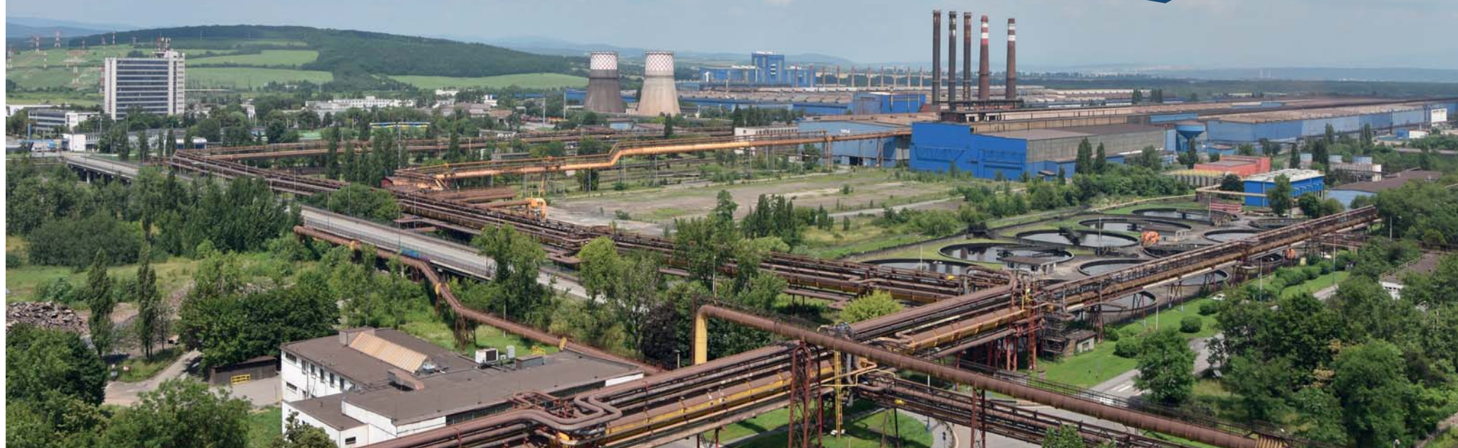
Dňa 24. novembra uplynulo presne 20 rokov od vzniku U. S. Steel Košice. V dnešnom vydaní Ocele východu vám prinášame nielen míľniky, ktoré sme za toto obdobie dosiahli, ale aj hodnotenie spolupráce a blahoželania od našich partnerov – zákazníkov, predstaviteľov samospráv, škôl, charitatívnych organizácií, kultúry a športu.