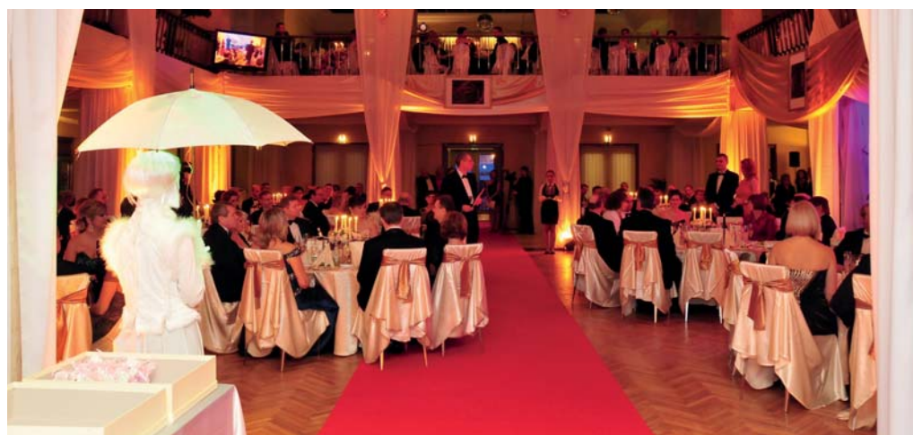
Plesy U. S. Steel Košice usporadúvané v sídle Štátnej filharmónie Košice, Dome umenia, patrili vždy k nezabudnuteľným.

Mám v živjej pamäti to nadšenie, keď prichádzala spoločnosť U. S. Steel do Košíc. Ani sme sa nenazdali, ubehli dve