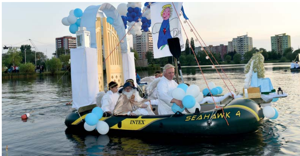
Niekoľko rokov sa deti a dospelí z Detského domova sv. Hofbauera v Podolínci zúčastňujú obľúbeného podujatia Košické Benátky. Vždy patria k favoritom a v súťaži netradičných plavidiel väčšinou víťazili.

Predstavím si máj a deň dobrovoľníkov. Vždy sa u nás stretne skupina milých ľudí, ochotných pomáhať iným, odvedieme veľký kus fyzickej práce a v srdci ostáva príjemný pocit z pekných myšlienok, ktorá je schovaná v jednoduchej vete: Hutníci pre Košice. Veľmi nás teší samotný záujem spoločnosti U. S. Steel Košice o naše zariadenie a o život v ňom. Snažíme sa hendikepovaným deťom vytvárať také podmienky, ktoré im pomôžu rozvíjať ich individuálne schopnosti. A to, čo spoločne aj s košickou oceľiarňou pre nich robíme, dáva životu ten správny zmysel. Verím, že naša spolupráca sa bude v budúcnosti naďalej rozvíjať a upevňovať.