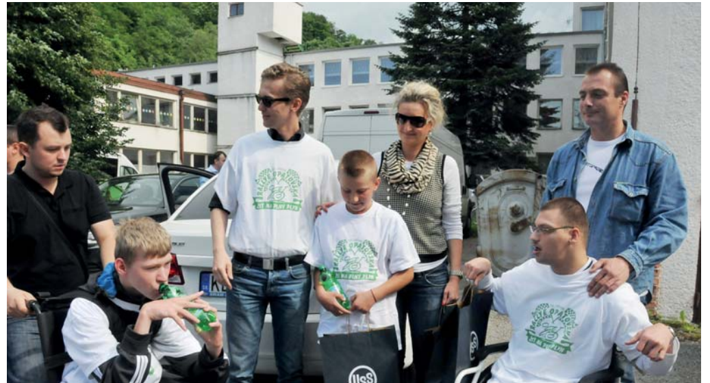
Podujatia Rally Opatovská sa každoročne zúčastňujú viacerí manažéri U. S. Steel Košice.

že sa akosi priblížili. Už nie sú ďaleko, sú blízko. Čo pre nás znamená spolupráca s fabrikou? Možnosť pre naše deti objavovať svet a život aj mimo malého Podolínce. Možnosť zažiť to, čo by sme u nás nikdy nezažili. Možnosť stretnúť vzácných ľudí. Spolupráca s ľuďmi z U. S. Steel Košice pred nás kladie nové výzvy, posúva našu prácu do iného levelu, núti nás vyburcovať naše často skryté možnosti. Budem rád, ak táto spolupráca bude pokračovať, lebo buduje ľudí a vytvára mosty. Za tie roky som stretol veľa ľudí z U. S. Steel Košice a v mene našich de-