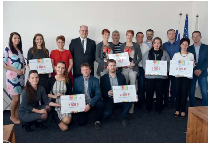
Desiatky zmysluplných projektov podporila spoločnosť U. S. Steel Košice prostredníctvom projektu Spoločne pre región.

U. S. Steel Košice stál pri nás už v našich začiatkoch. Poskytol nám finančnú pomoc na rekonštrukciu sociálnych zariadení. V priebehu ďalších desiatich rokov nám v rámci Dňa dobrovoľníkov zamestnanci U. S. Steel Košice významne pomohli pri vytváraní detského ihriska,